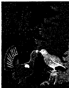
Les amours du grand tétras.