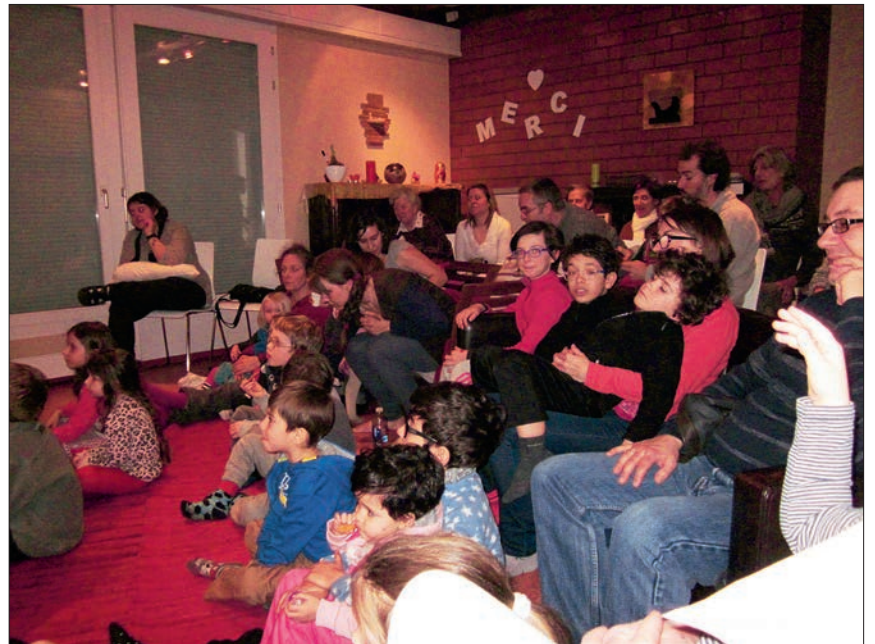
Les deux représentations ont affiché complet ce week-end à l'Espace Indigo.

Prochaines représentations Actuellement en tournée du côté de Genève, puis à La Chaux-de-Fonds