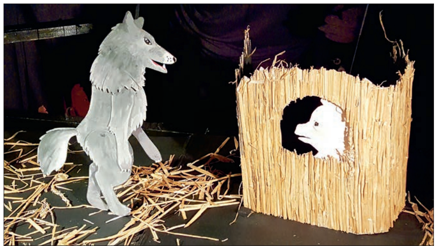
« Ah ! Ça non, par les poils de menton ! Je ne sortirai pas, méchant loup ! »