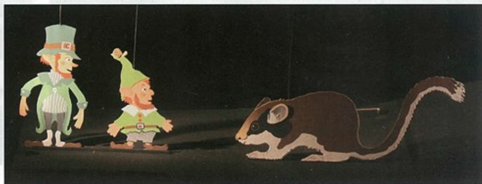
Brunсли converse avec les lutins.