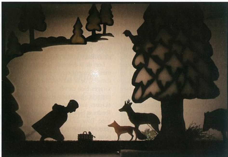
Le bûcheron apporte de la nourriture aux animaux pour se faire pardonner.

êtres microscopiques que les plantes les plus humbles, c'est la raison pour laquelle elle a choisi de faire vivre une parcelle de forêt, cette dernière changeant au gré des saisons ou de l'activité humaine, particulièrement importante depuis quelques années !